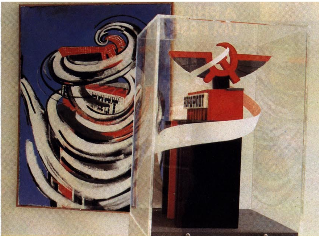
ARQUIVO DO ARTISTA

■ The painting and the model of the Aeroflot building in Moscow (which in fact doesn't exist): a tribute to Soviet constructivism